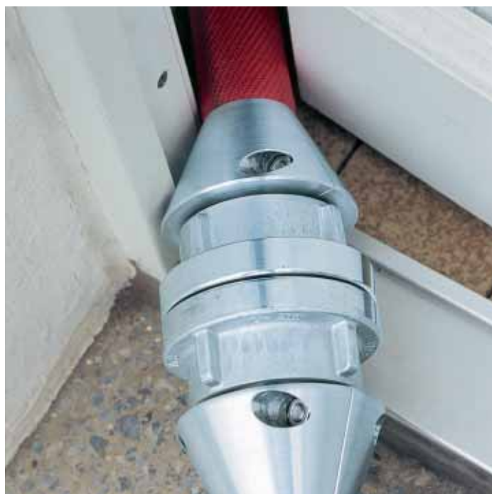
Kein Problem mit zufallenden Türen: Der Schlauch lässt sich ganz einfach durchziehen

tet werden kann, womit auch die Ausbreitung des Brandrauchs auf C-Schlauch-Spaltenbreite beschränkt wird.