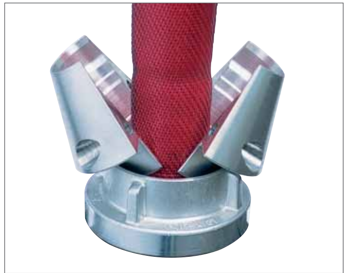
Die zwei Hälften des Klemmgleitrings werden bis zum Anschlag unterhalb des Knaggeteils geschoben