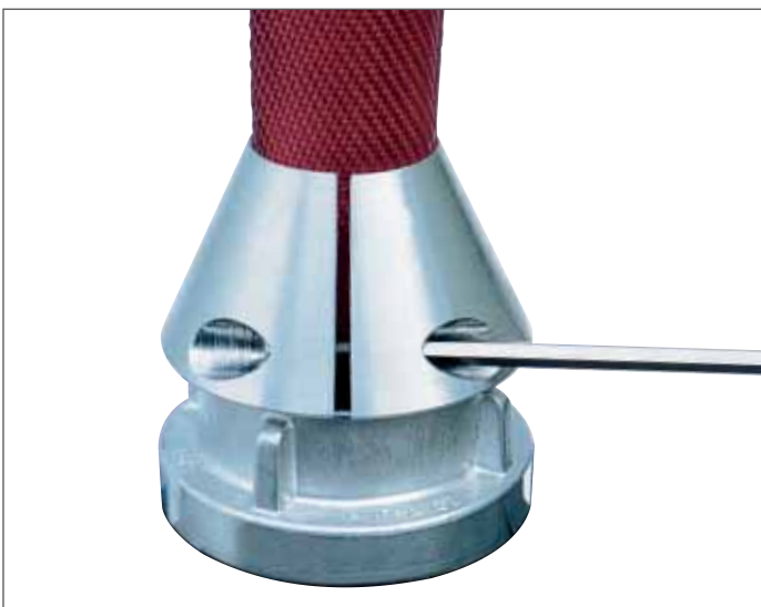
Die beiden Hälften werden mit zwei Inbusschrauben fest zusammengeschraubt