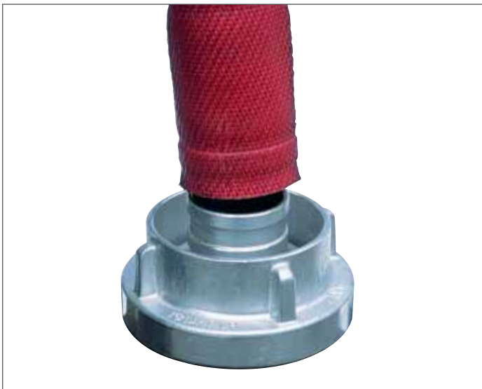
Das Schlauchende auf den Storzstutzen schieben

Keine aufwendige Drahteinbindung, einfache Fixierung und Einspannen des Schlauchs auf den Storzstutzen per Inbusschlüssel, Reparaturen von jeder Seite des Schlauchs aus: Der Klemmgleitring iconos ® kann innerhalb kürzester Zeit ohne Fachkenntnisse auf den Schlauch montiert werden. Das ist auch bei Reparaturen während eines Einsatzes möglich. Mit dem iconos ® lassen sich alle Schläuche der Bauart C-42, C-52 und B-75 problemlos umrüsten auf den Storzstutzen nach DIN.