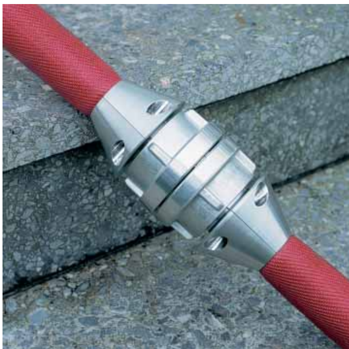
Die mit iconos ® eingebundene Schlauchkupplung gleitet mühelos über alle Hindernisse hinweg

Mit dem neu entwickelten Klemmgleitring iconos ® gehören diese Probleme weitgehend der Vergangenheit an. Denn dieses ebenso einfache wie geniale Zubehörteil optimiert die größte Schwachstelle des Schlauchs: die Kupplung. Dank seiner konischen Form erleichtert iconos ® das Verlegen und Ziehen des Schlauchs insbesondere in Treppenhäusern und um Ecken oder durch Türen hindurch wesentlich. Das Verhaken des Schlauchs wird erheblich reduziert. Darüber hinaus lassen sich angelehnte Türen durch einfaches Nachziehen des Schlauchs mit dem Klemmgleitring wieder öffnen, so dass auf das Feststellen der Türen größtenteils verzich-