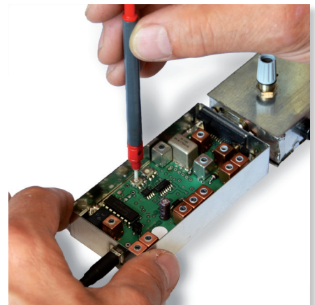
Abb. 2: Kundenspezifischer Gerätecheck