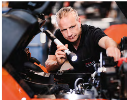
Toyota Service Concept