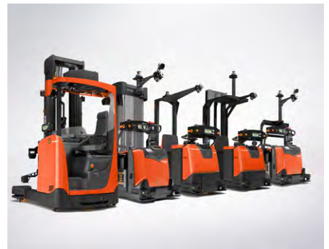
Toyota Autopilot Serie