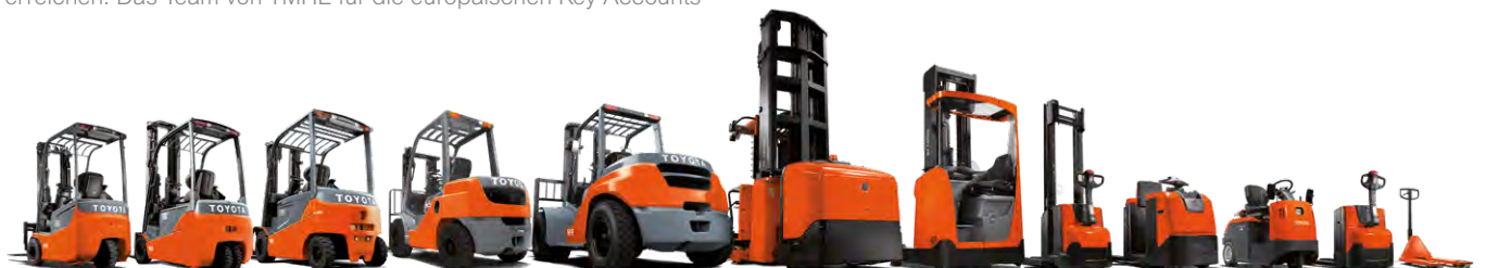
TMHE Angebotspalette: Gegengewichtstapler, Lagertechnikgeräte und Schlepper